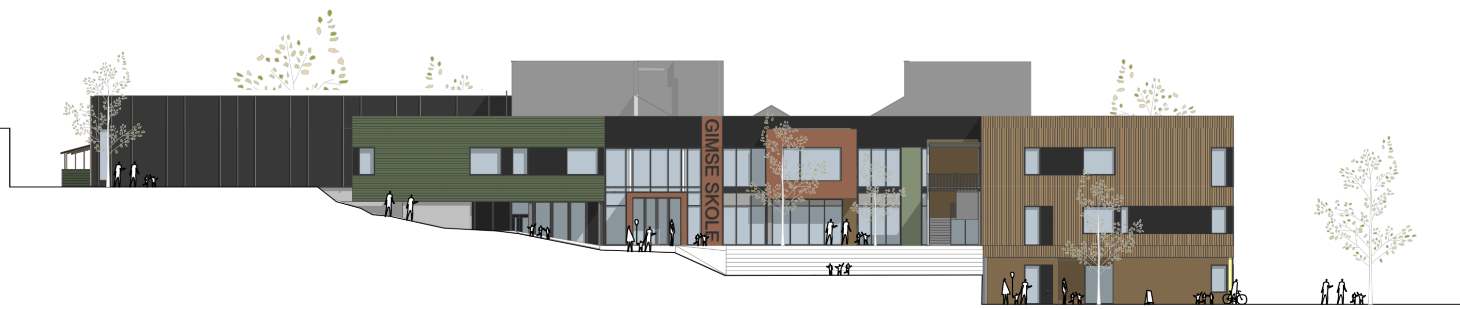
FASADE SØR ØST