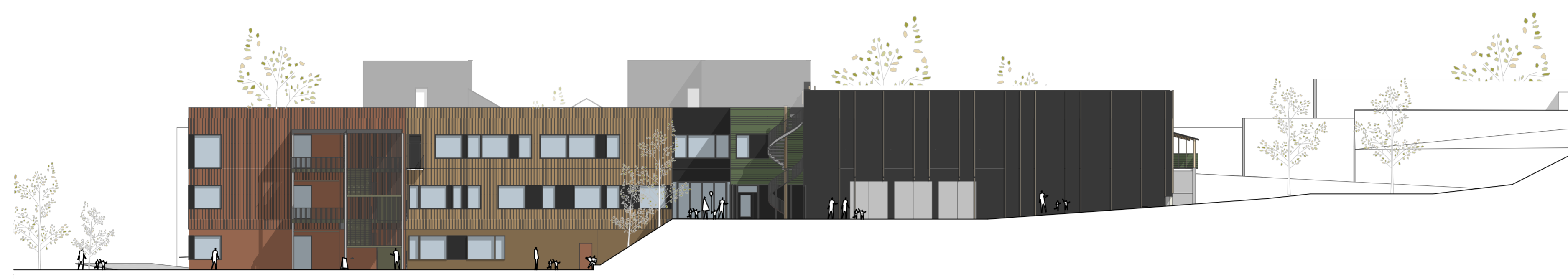
FASADE NORD VEST